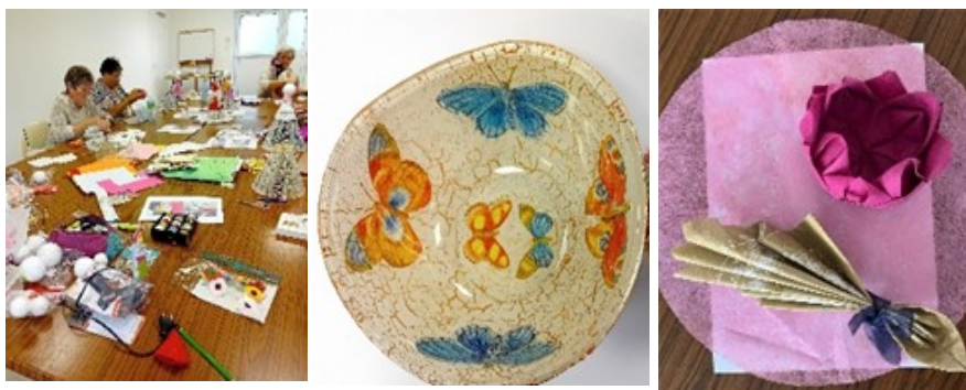
Ateliers : Livres pliés, vaisselle craquelée et décoration table