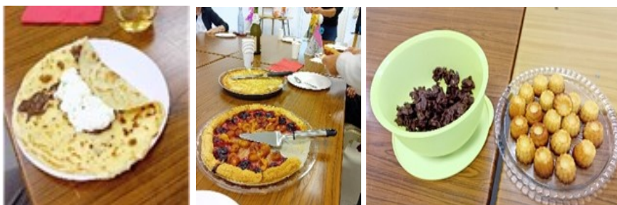
A chacun(e) sa spécialité pour préparer le goûter