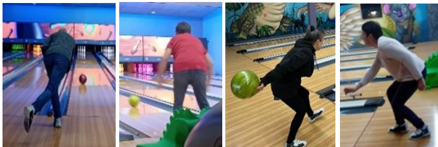
Sortie bowling : à chacun(e) son style

Temps Libre est une association qui permet de se retrouver pour partager des moments de convivialité, découvrir différentes techniques de petit bricolage lors d'ateliers de loisirs créatifs et participer à des sorties.